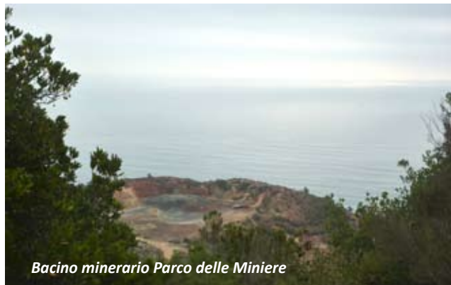
Bacino minerario Parco delle Miniere