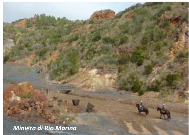
Miniera di Rio Marina