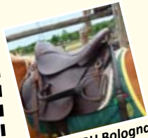
Selleria BH Bologna

Selleria Lamberto Bartolozzi in Tolfa (Rm)